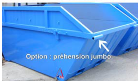
Option : préhension jumbo