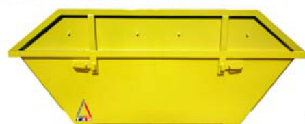
Base 5 m 3 avec réhausse ouverte sur 2 côtés (vidage des 2 côtés).