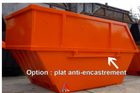
Base 5 m 3 avec réhausse ouverte d'un seul côté.