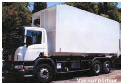
Vue sur porteur

Il est équipé d'un hayon élévateur (sol - 1er étage - 2nd étage)